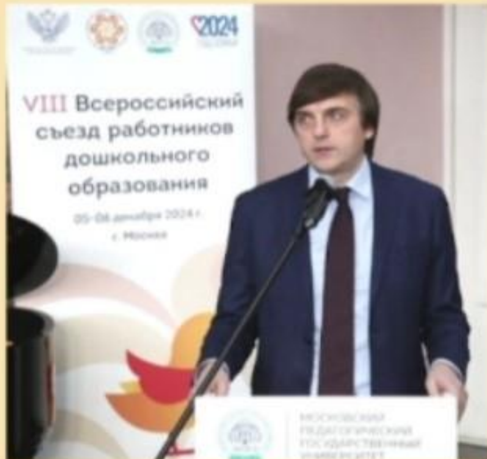
С.С. Кравцов, Министр просвещения РФ, 5.12.2024, VIII Всероссийский съезд работников дошкольного образования

... от того, насколько качественно система дошкольного образования вместе с родителями организует воспитание детей и создаёт условия для их гармоничного развития, во многом зависит будущее подрастающего поколения. Сегодня необходимо повысить значимость этой сферы.