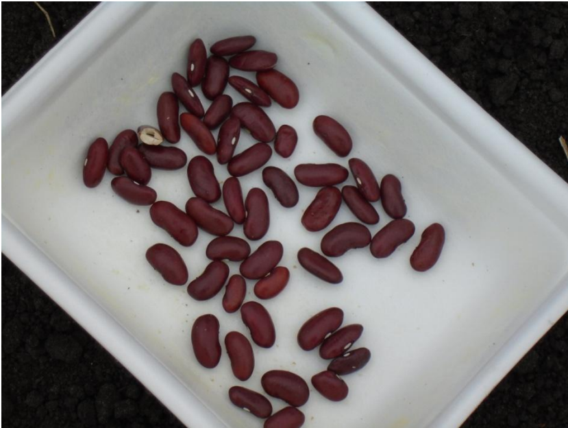
Сухие семена фасоли