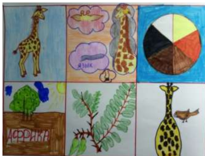
Рис. 4.Мнемотаблица. Жираф.

В своем выступлении на педагогическом совете в деловой игре «Знайки речевого развития» познакомила педагогов с преимуществами наглядного моделирования. Также был проведен семинар- практикум для педагогов нашего района «Развитие связной речи детей дошкольного возраста посредством мнемотехники». Был организован и проведен конкурс «Чтецов» для дошкольников нашего детского сада. Цель конкурса - научить детей читать стихи выразительно и интересно.