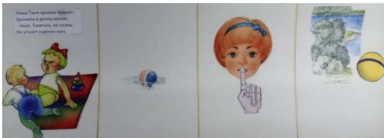
Рис. 2. Мнемотаблица. Стихотворение А. Барто. Наша Таня.

Для автоматизации звуков на этапе работы с небольшими стихотворениями можно использовать заранее нарисованные мнемотаблицы. Для этого подбираются небольшие стихотворные тексты или загадки, на автоматизацию определённого звука или дифференциацию звуков. Затем при помощи простых и доступных для восприятия ребёнка символов дети рисуют мнемотаблицы сами. Я разработала авторские карточки, для автоматизации звуков используя стихотворения А. Барто.