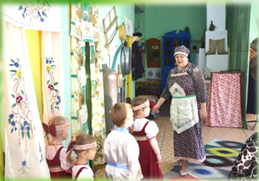
Знакомство детей с мини-музеем «Русская изба»