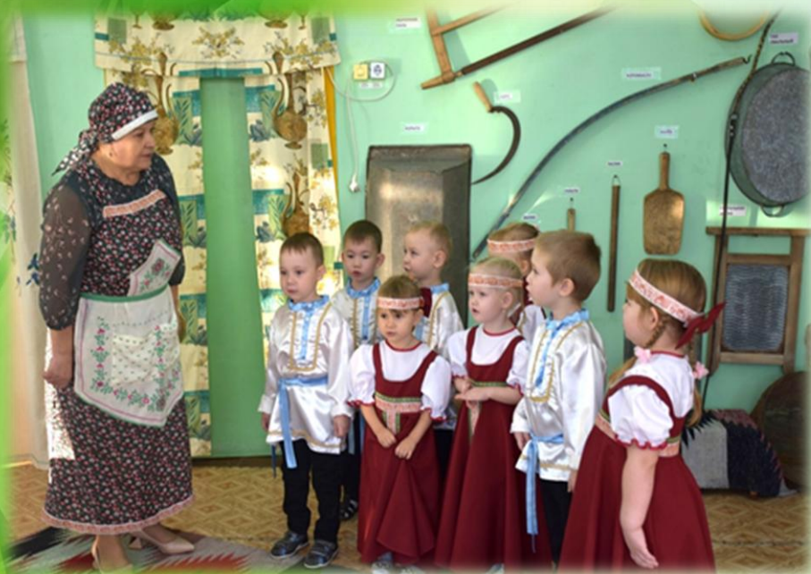
Знакомство с предметами быта