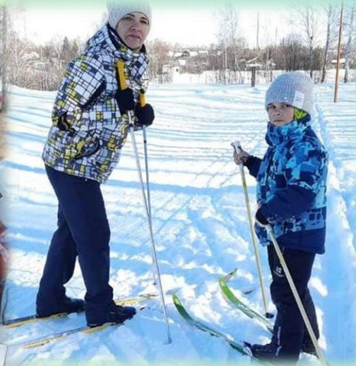
«Экскурсионные маршруты выходного дня»