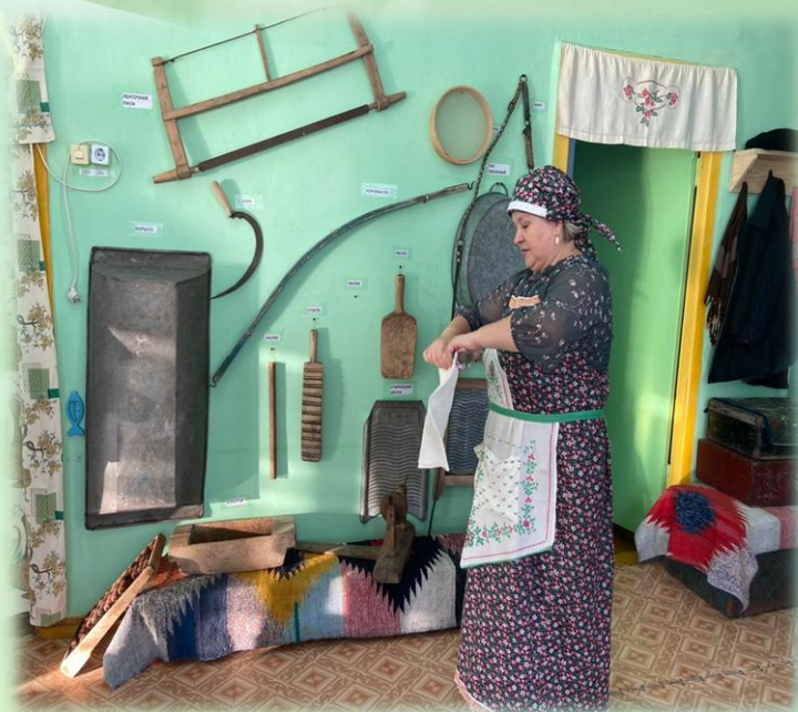
Ситуативная беседа «Как стирали на Руси»