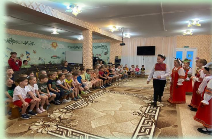
Детская школа искусств Фольклорный концерт «Про горох»