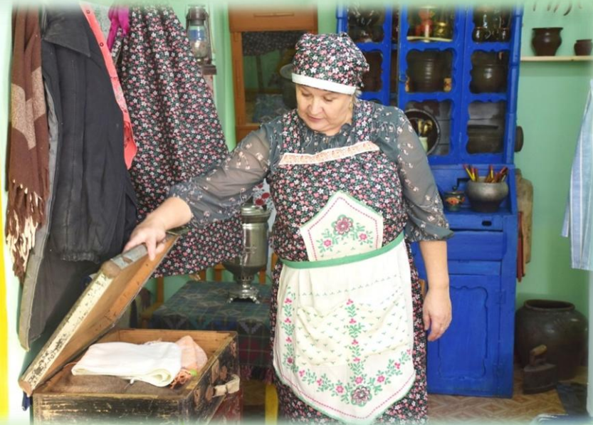
Ситуативная беседа «Прабабушкин сундук»