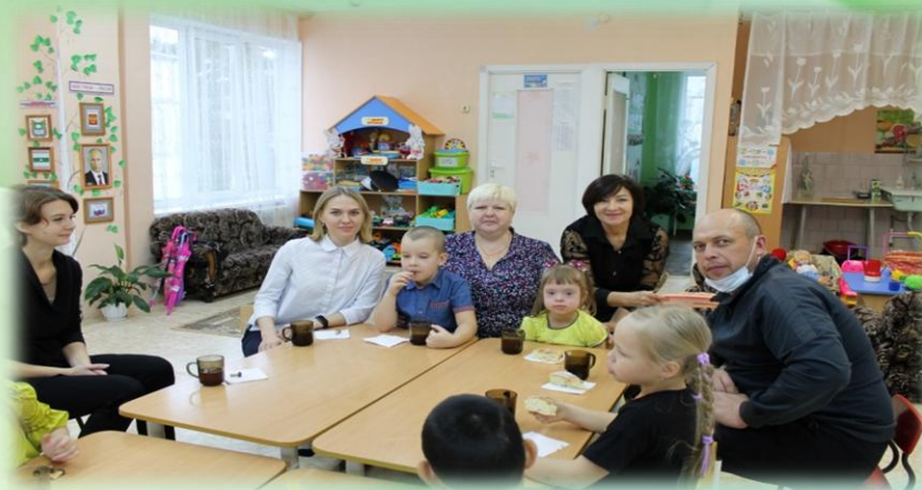
Семейная гостиная «За круглым столом»