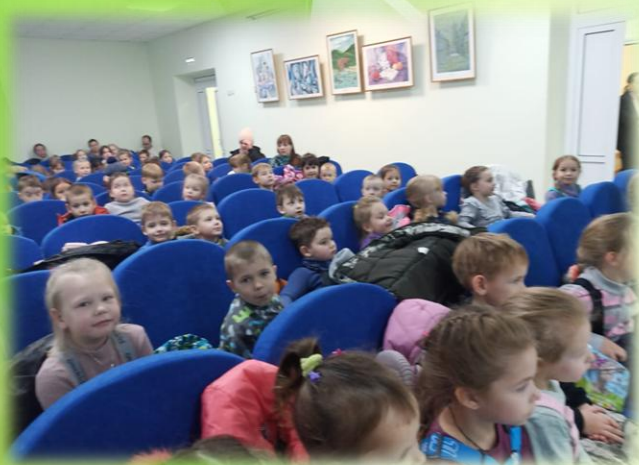
Преподаватели школы искусств