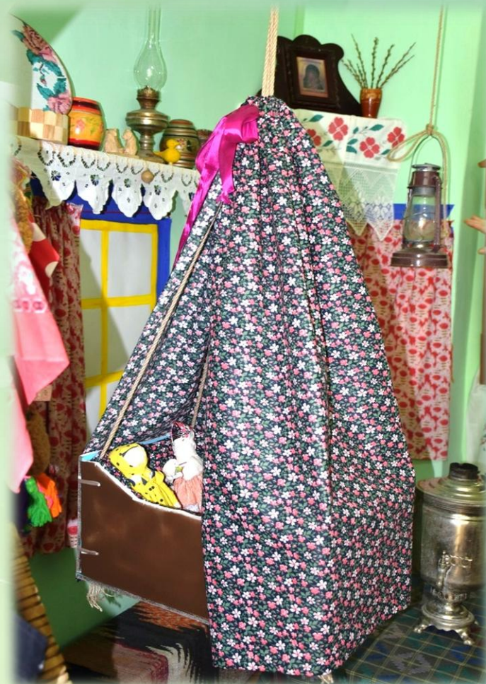
Мини-музей «Русская изба»