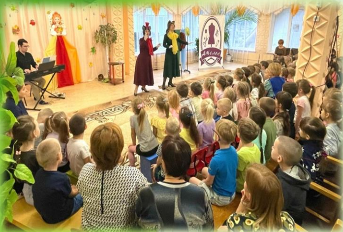
Курганская филармония Детская опера «Шапка с ушами»