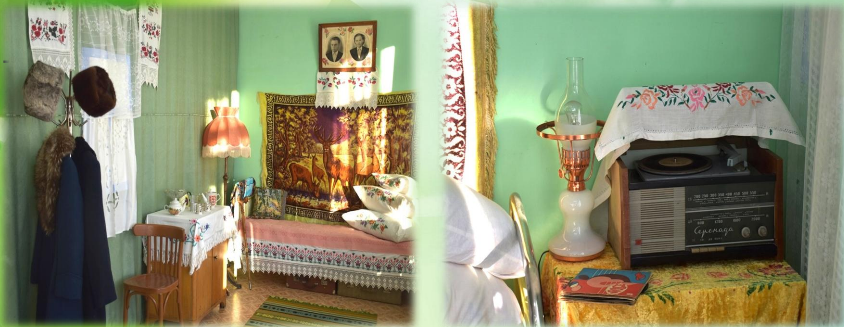
Комната середины прошлого века