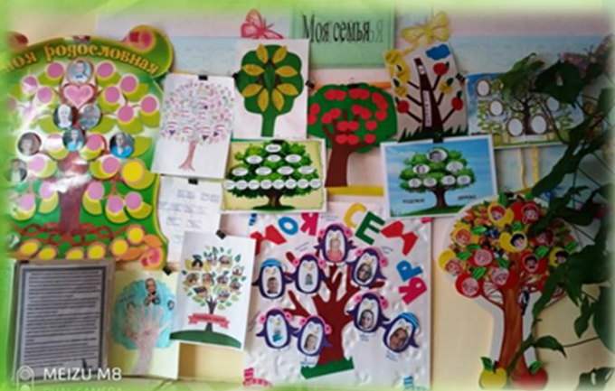
Творческий проект «Моя родословная»