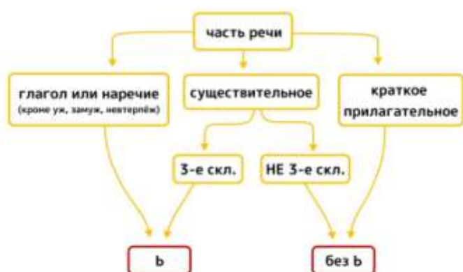
Алгоритм МЯГКИЙ ЗНАК ПОСЛЕ ШИПЯЩИХ