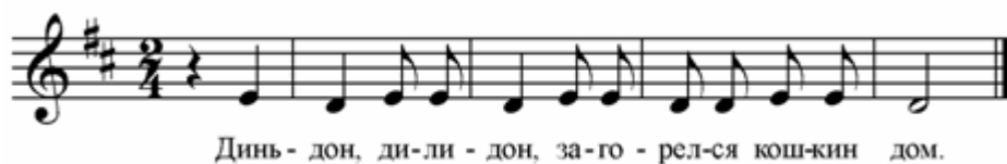
Рис.3. Распевка «Кошкин дом»

локолов и совсем маленьких колокольчиков. При переходе во вторую октаву можно предложить детям показывать рукой движение, имитирующее встряхивание маленького колокольчика. Такое лёгкое мышечное движение передаётся на связки, и звучание голосов становится лёгким и более интонационно точным.