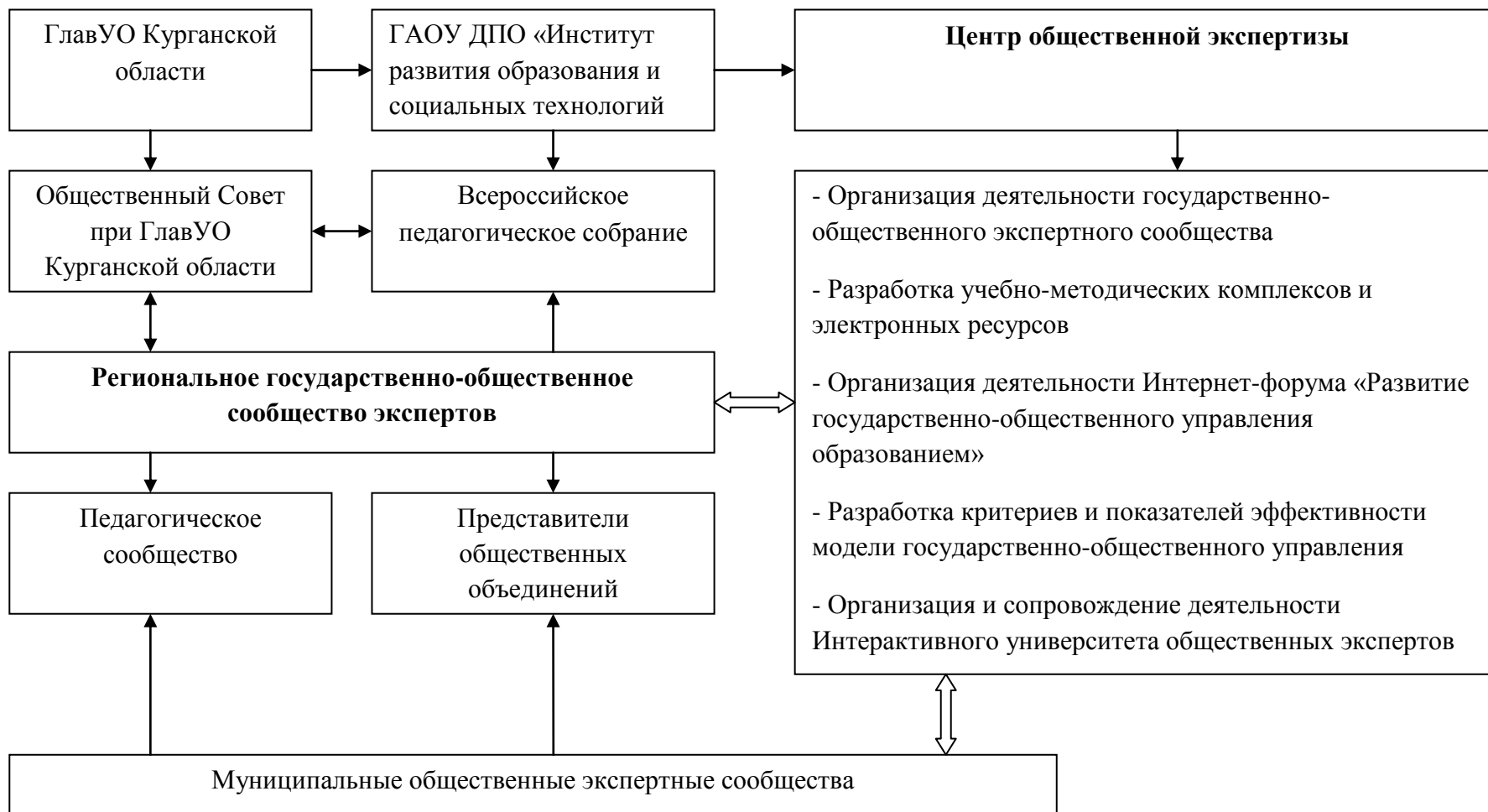
Региональная модель формирования общественного экспертного сообщества